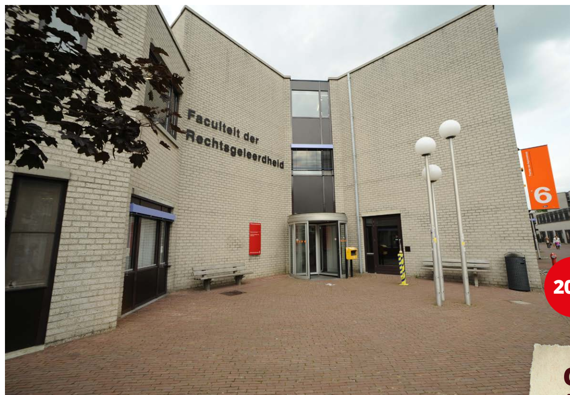
Thomas van Aquinostraat 6, tot 2014 het onderkomen van de rechtenfaculteit