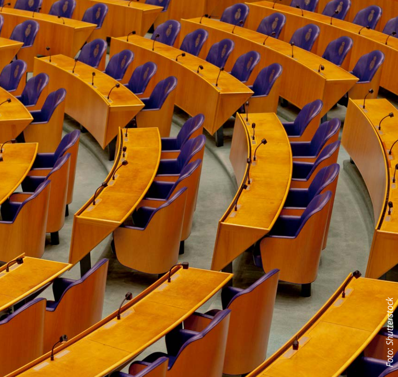
In de politiek schuurt het steeds vaker langs de randen van het staatsrecht. Zo ook in de Tweede Kamer.